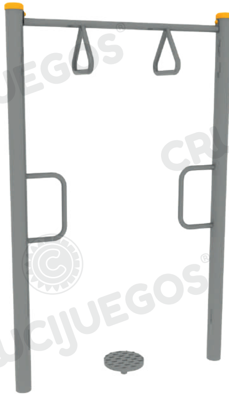
Imagen referencial. Para más información ingrese a www.insumos.crucijuegos.com