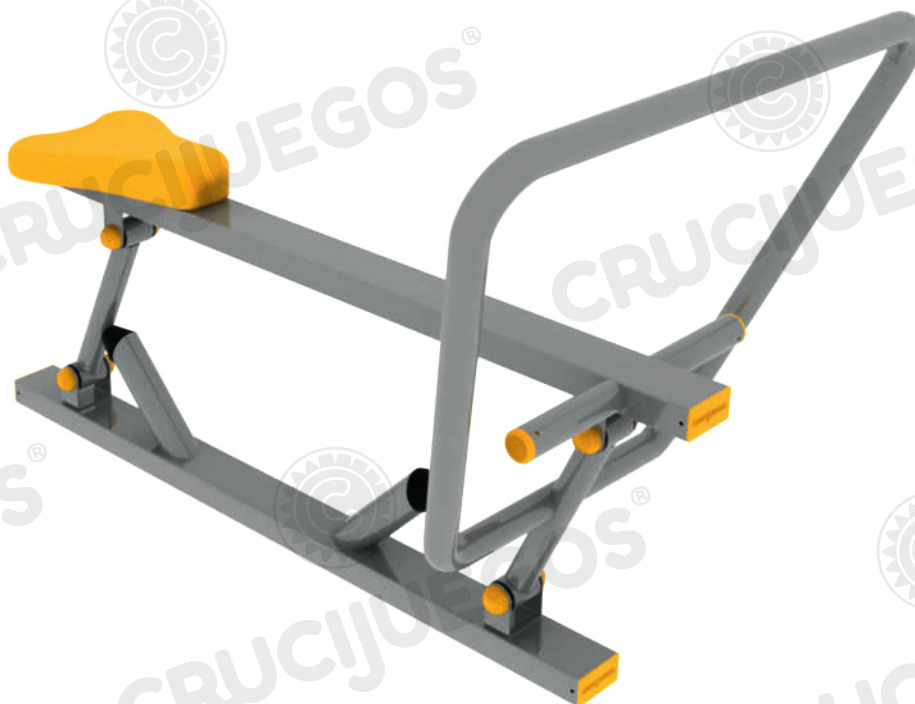
Imagen referencial. Para más información ingrese a www.insumos.crucijuegos.com