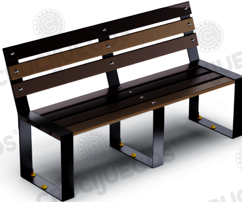
Imagen referencial. Para más información ingrese a www.insumos.crucijuegos.com