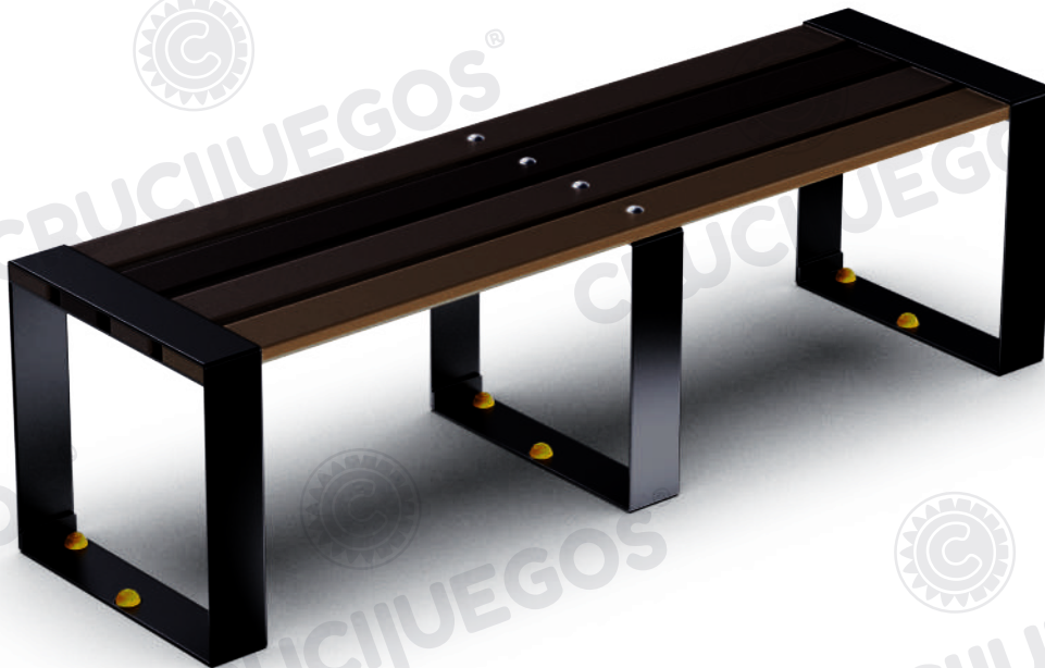
Imagen referencial. Para más información ingrese a www.insumos.crucijuegos.com