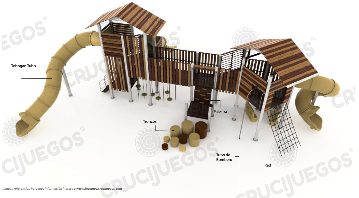
Imagen referencial. Para más información ingrese a www.insumos.crucijuegos.com