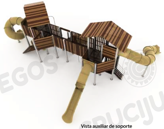
Vista auxiliar de soporte