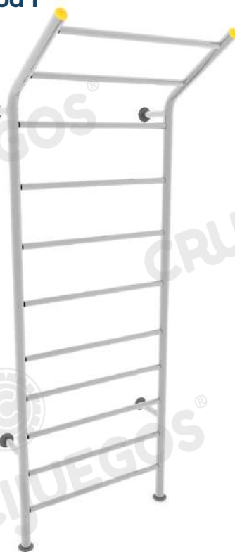
Imagen referencial. Para más información ingrese a www.insumos.crucijuegos.com