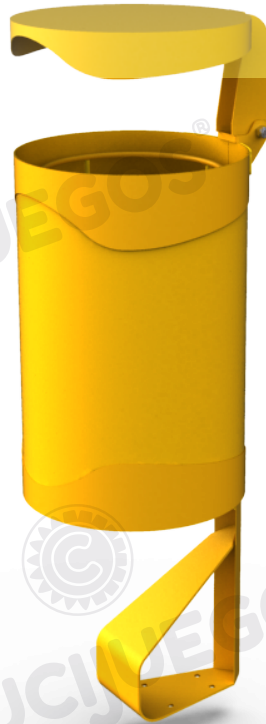
Imagen referencial. Para más información ingrese a www.insumos.crucijuegos.com