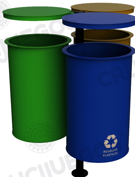
Imagen referencial. Para más información ingrese a www.insumos.crucijuegos.com