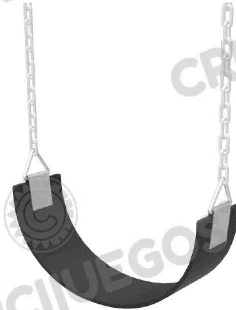
Imagen referencial. Para más información ingrese a www.insumos.crucijuegos.com