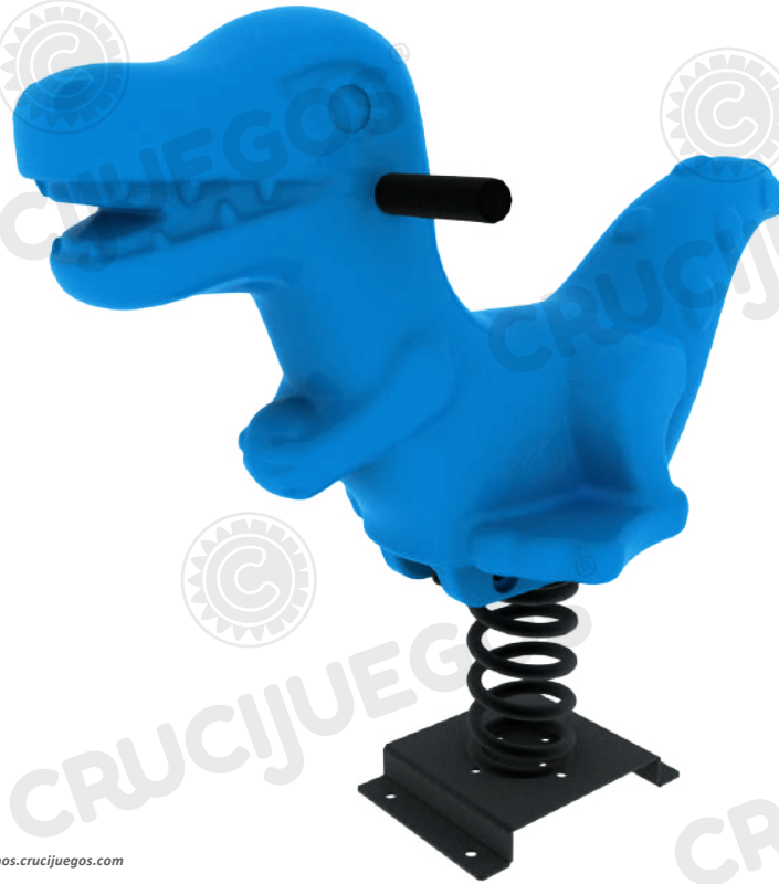
Imagen referencial. Para más información ingrese a www.insumos.crucijuegos.com