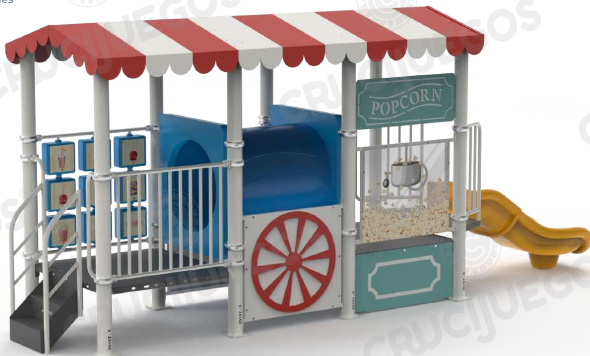
Imagen referencial. Para más información ingrese a www.insumos.crucijuegos.com