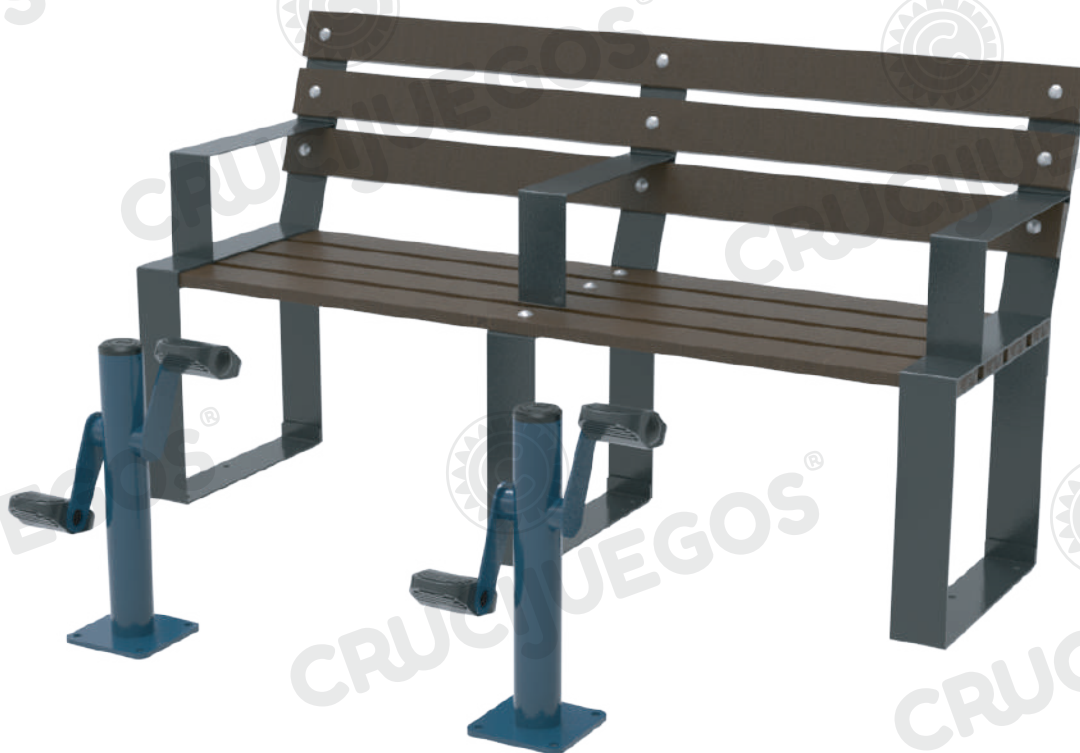
Imagen referencial. Para más información ingrese a www.insumos.crucijuegos.com