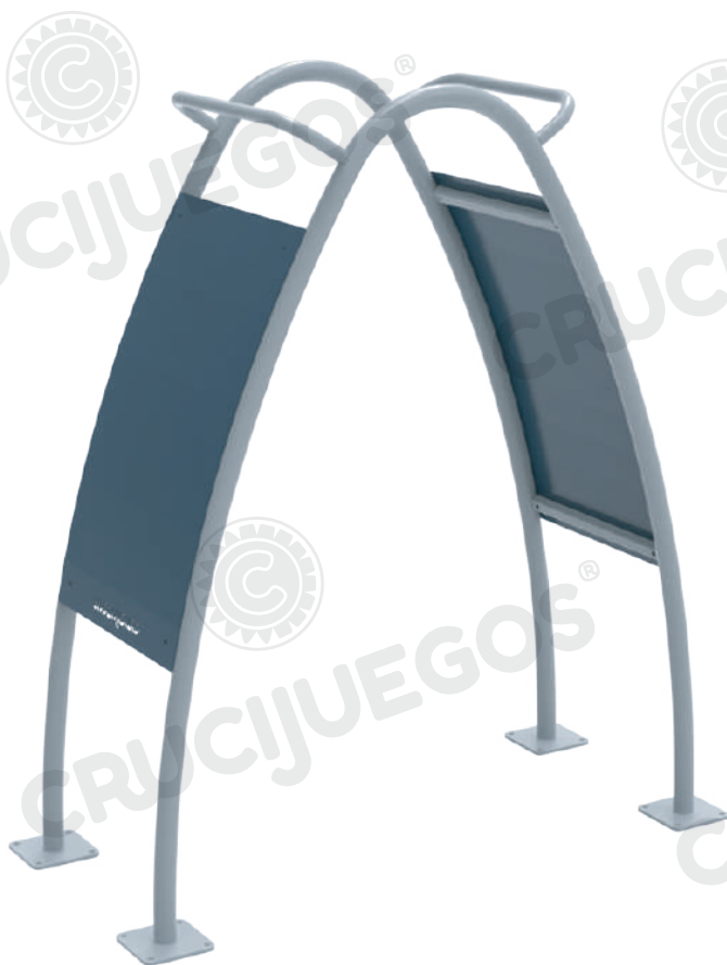
Imagen referencial. Para más información ingrese a www.insumos.crucijuegos.com