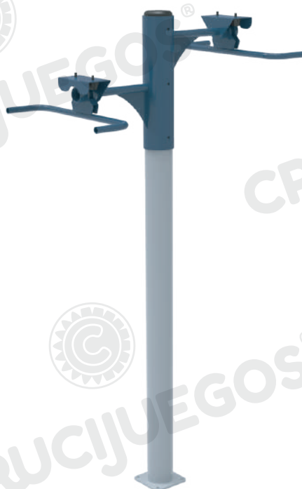
Imagen referencial. Para más información ingrese a www.insumos.crucijuegos.com